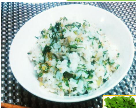
茶碗1杯(ご飯150gの場合) エネルギー319kcal 塩分0.8g