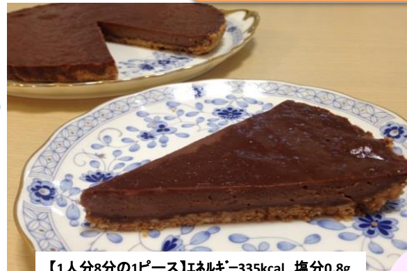
【1人分8分の1ピース】エネルギー・335kcal 塩分0.8g